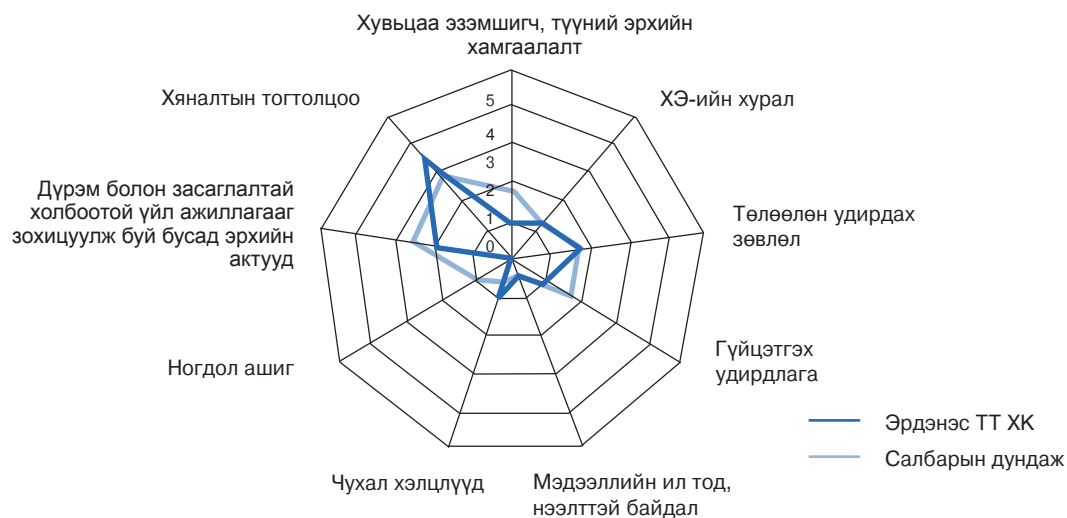
Зураг 1. Эрдэнэс ТТ ХК-ийн засаглалын түвшинг төрийн өмчит уул уурхайн компаниудын дундаж үзүүлэлттэй харьцуулсан байдал

Компанийн ерөнхий үнэлгээ нь төдийлөн сайн биш байгаа боловч зарим үзүүлэлт тухайлбал, хувьцаа эзэмшигчийн эрхээ хэрэгжүүлэх чухал нөхцлүүдийн нэг болсон хувьцаа эзэмшигчдийн бүртгэлийг Компанийн тухай хуульд заасны дагуу энэ ажлыг эрхлэх тусгай зөвшөөрөл бүхий этгээдтэй гэрээ байгуулан хэрэгжүүлж байгаа учраас ХЭ-ийн бүртгэл, түүний хөтлөлт, бүртгэлийн агуулга үзүүлэлтээр 5 оноо авсан байна. Энэ нь хувьцаа эзэмшигчдийн эрхээ хэрэгжүүлэх нөхцлийг бүрдүүлэх талаар компанийн зүгээс хүлээсэн үүргээ сайн хэрэгжүүлж байгаа жишээ юм. Үүнээс гадна тус компанийн Гүйцэтгэх захирал болон түүний удирдлагад ажилладаг ажилтнууд ТУЗ-ийн гишүүн биш байгаа нь ТУЗ-ийн зүгээс гүйцэтгэх удирдлагатай ажиллахад аливаа сонирхлын зөрчил үүсгэхгүй болгосон учир үүнтэй холбоотой асуулгуудад 5 оноо авсан байна. Үүнийг Зураг 2-т үзүүлэв.