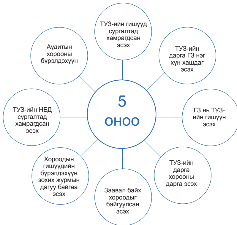
Зураг 2. Эрдэнэс ТТ ХК-ийн засаглалын үнэлгээнд сайн үнэлгээ буюу 5 оноо авсан асуулгууд

Үүнээс гадна үнэлгээний үзүүлэлтийн нийт 131 асуулгаас 68 буюу 51.9 хувьд нь “0” үнэлгээ авсан нь эдгээр үзүүлэлтийн хувьд тус компани дээр тодорхой зүйл хийгдэхгүй байгааг харуулж байна. Энэ нь тус компанийн засаглалын түвшин доогуур гарах гол шалтгаан болсон. Нийт үнэлгээнд “0” үнэлгээ авсан асуулгуудын эзлэх хэмжээг Хүснэгт 2-т үзүүлэв.